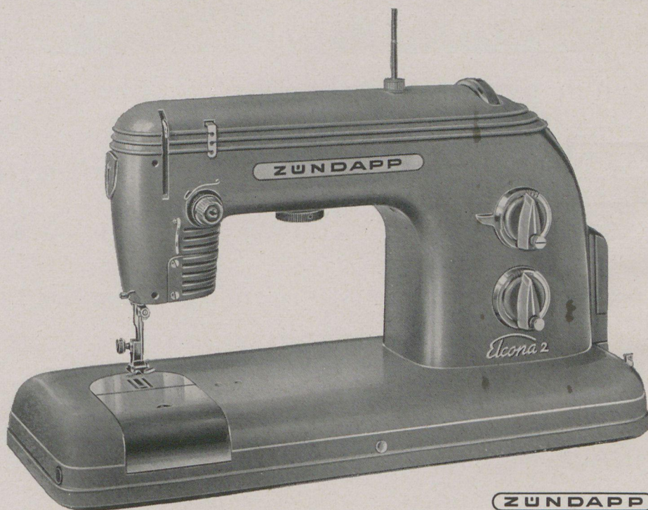
ZUNDAPP Elcona 2

Eine vollelektrische Koffernähmaschine mit vielen Vorzügen. — Der unempfindliche Brillengreifer, Gelenkfadenhebel und das Ölbadgetriebe sichern erschütterungsfreien, leisen Lauf. Durch das blendungsfrei eingebaute Nählicht wird die Arbeitsstelle unter der Nadel günstig beleuchtet und gestattet das Nähen ohne zusätzliche Lichtquelle.